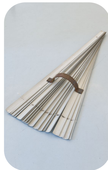
Ana Santos Sin título , 2013

Ana Santos utiliza objetos que encuentra para crear sus esculturas. Coloca los objetos de manera diferente a la habitual en el espacio donde expone las obras. Esto hace que el visitante vea las piezas e imagine una escena donde el significado de cada objeto cambia. De esta forma, la escena cuenta cosas distintas.