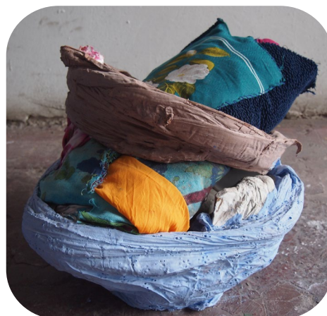
Elena Aitzkoa Tu corazón , 2018

Sus esculturas también incorporan procesos de performance porque sus esculturas parece que están en movimiento, incluso que respiran.