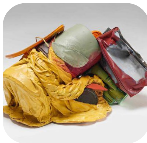
Miren Doiz, Serie Un paisaje personal y culpable S/T, 2020.

A Miren Doiz le gusta reflexionar en sus obras sobre temas de ecología y cuidado del medio ambiente.